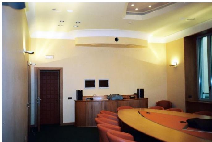
Universal Music - Milano Progetto di correzione acustica