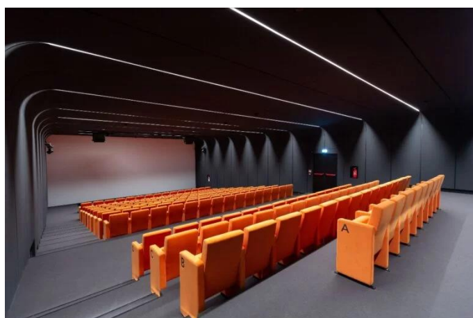
MEET Milano (spazio Oberdan) Studio e Progetto di correzione acustica del Auditorium