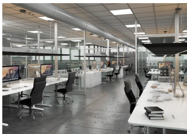
Sede DIOR Scandicci (FI) - Studio e Progetto di correzione acustica, uffici open space