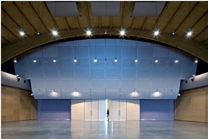
Studio e Consulenza Acustica nuovo Centro Congressi Autodromo di Vallelunga - Campagnano (RM)