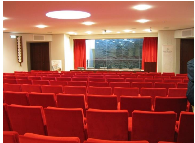
Progetto acustico sala Meliorbanca - Milano