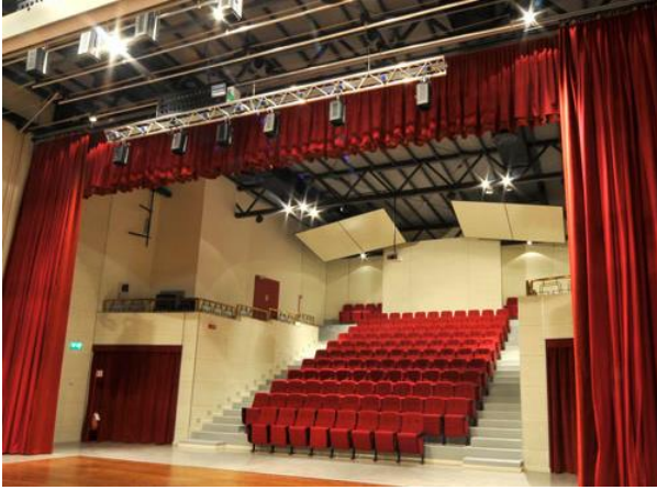
Studio e progetto acustico per la ristrutturazione del Teatro Cotogni - Castelmassa (RO)