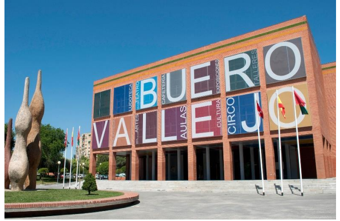
Analisi e consulenza acustica progettuale Teatro "Buero Vallejo" - Alcorcón, Madrid, (E)