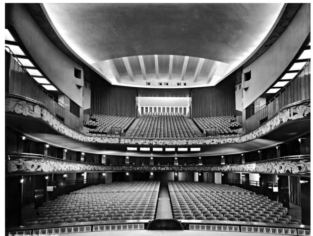
Studio e Consulenza Acustica per il Progetto Architettonico vincitore del Concorso per il Nuovo Teatro Lirico di Milano