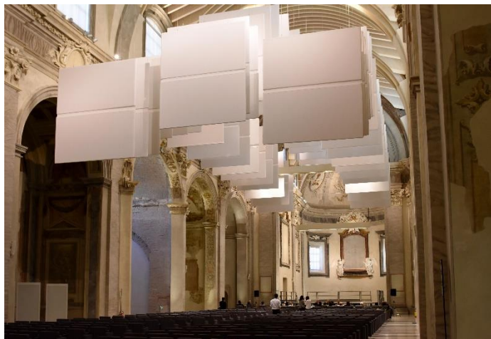
Studio e progetto di correzione acustica Chiesa di S. Giacomo di Forlì