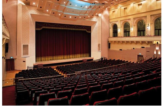
Studio e progetto correzione acustica MCC di Malta, per il concerto del M° Muti e l'orchestra del Maggio Fiorentino