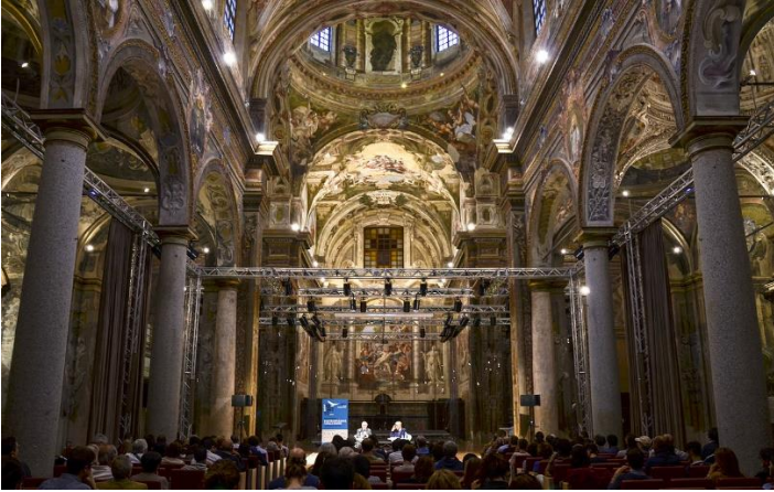
Studio e Progetto Acustico della nuova sala prove per l'orchestra Cherubini - Ex-chiesa dei Teatini -Piacenza